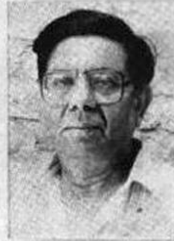
فکر خلیق انجم شخصیت اور خدمات